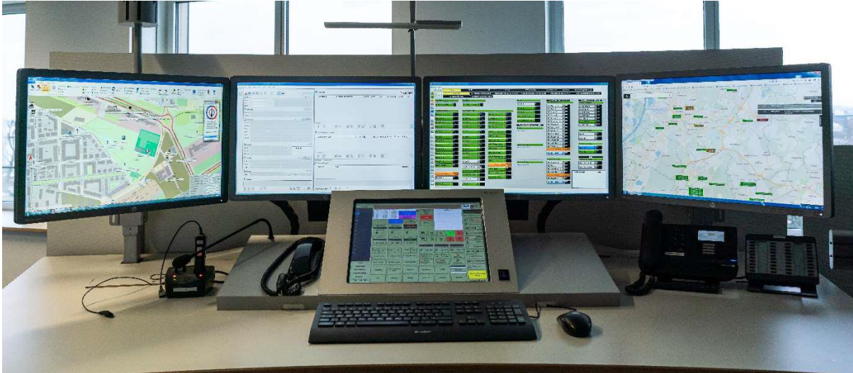
Der Arbeitsplatz eines/r Leitstellendisponenten*in